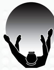
LAMPE FRONTALE EX-VIEW