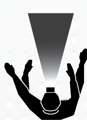
LAMPE FRONTALE STANDARD